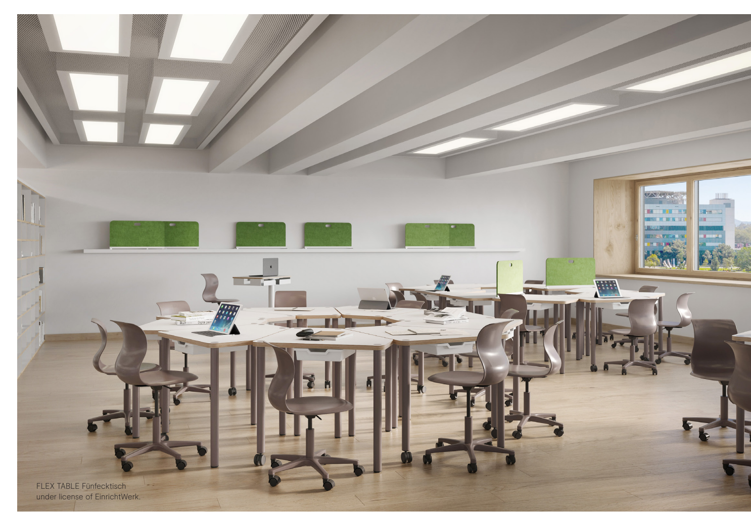
FLEX TABLE Fünfecktisch under license of EinrichtWerk.

Ihr Plakat für Lernräume. Your poster for the classroom.