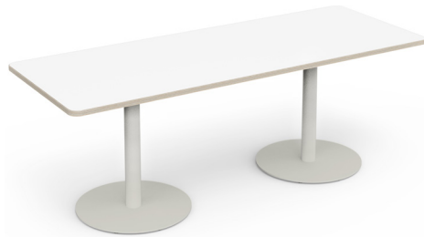
FIX TABLE Säulentisch Rechteckig