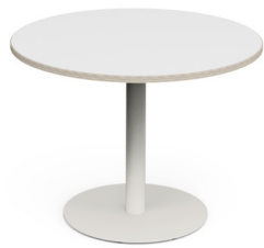
FIX TABLE Säulentisch Rund