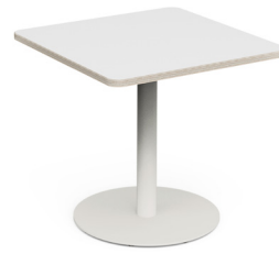
FIX TABLE Säulentisch Quadrat