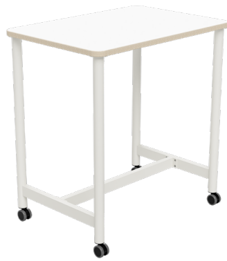
FLEX HIGH Work Ablage